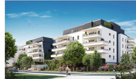
BATIMENT D - MONTEE 5 APPARTEMENT T2 N°5023 au R+2